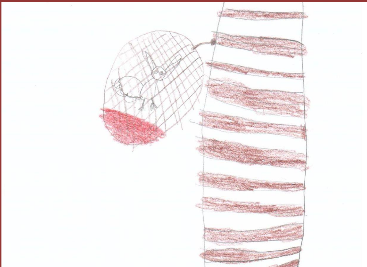
Kismókus pihen a fészekben